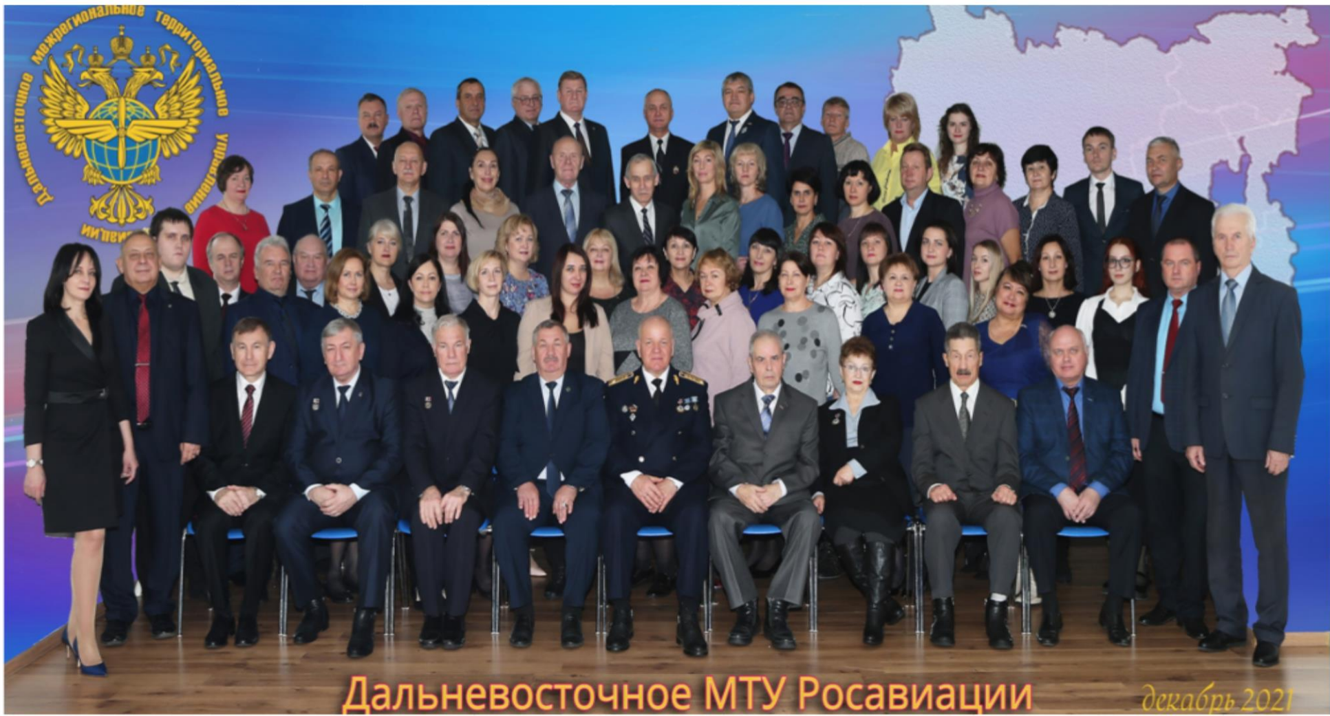
Дальневосточное МТУ Росавиации