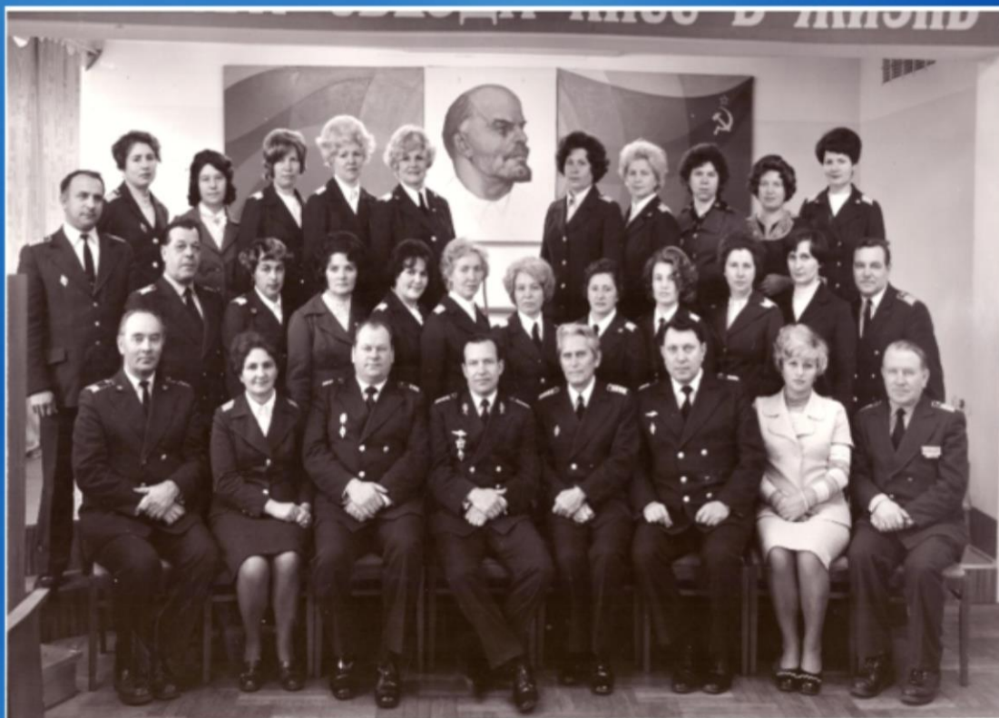
Работники экономических служб Дальневосточного управления гражданской авиации ноябрь 1978 г. г. Хабаровск