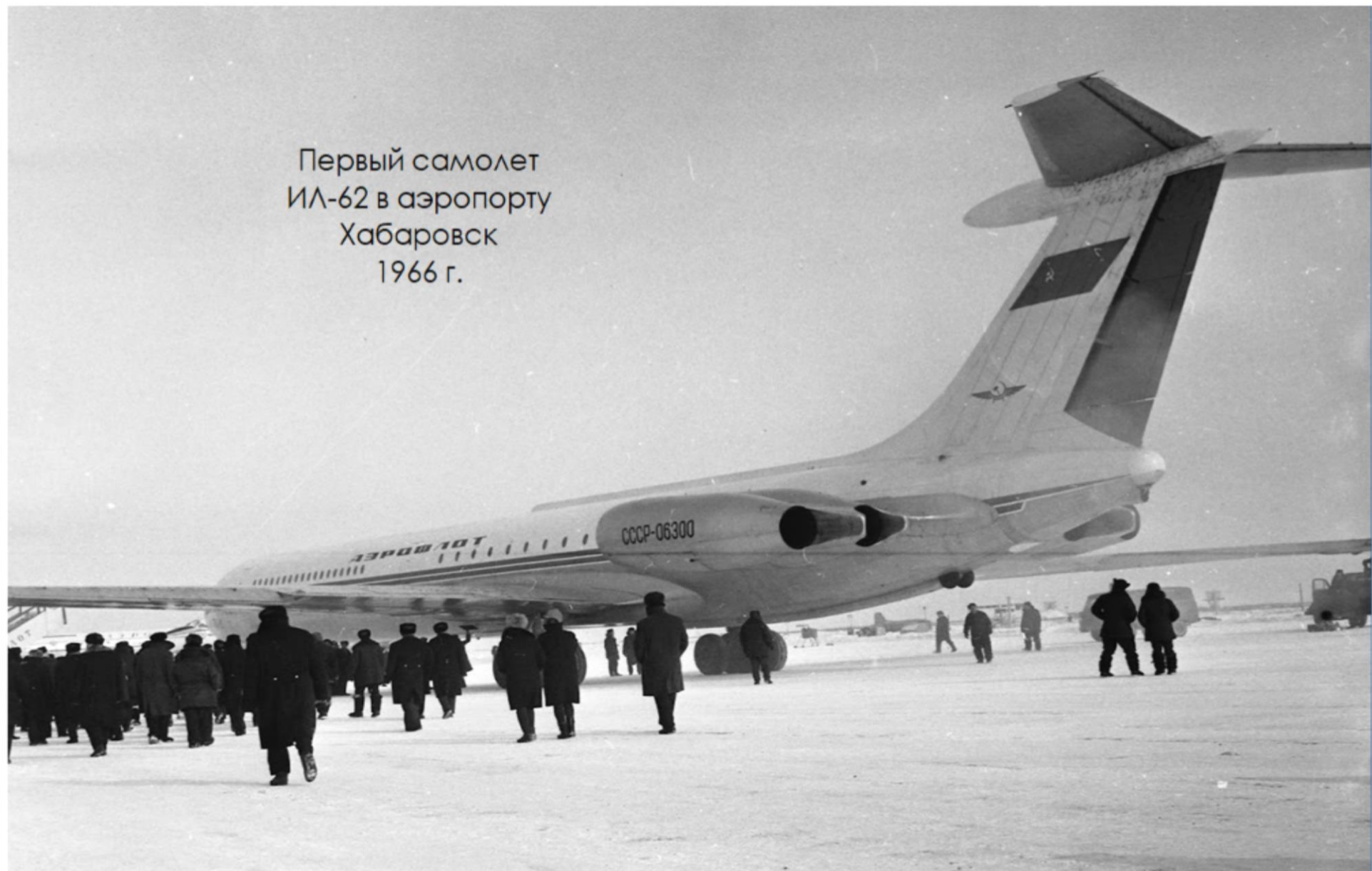
Первый самолет ИЛ-62 в аэропорту Хабаровск 1966 г.