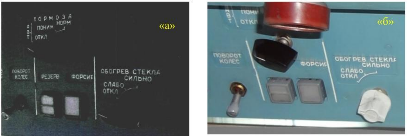
Рис. 2. Форма переключателей «Тормоза» и «Обогрев стекла» фактически установленных (а) и требуемых типовой конструкцией (б)

В ходе дополнительного анализа также отмечено, что установленная на самолете ручка на галетном переключателе обогрева стекол по форме не соответствовала предусмотренной типовой конструкцией (рис. 2, «б»).