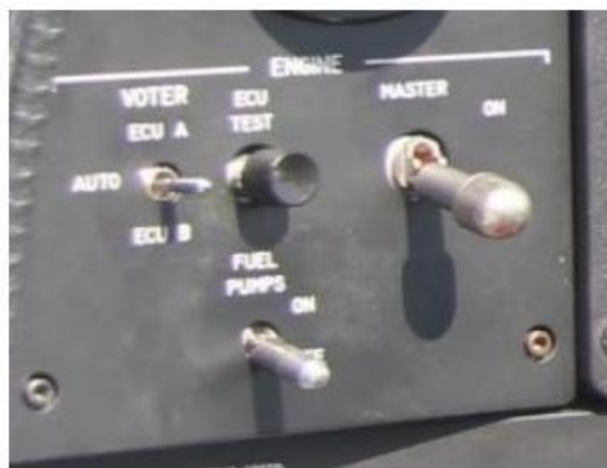
Рис. 3. Переключатели на панели «ENGINE»

Главный выключатель двигателя «ENGINE MASTER» мог быть установлен в положение «Выключено» из-за перепутывания с выключателем «FUEL PUMPS» (топливные насосы). Оба выключателя расположены в непосредственной близости друг от друга, форма выключателей «ENGINE MASTER» и «FUEL PUMPS» одинакова, способы воздействия (вытяжного типа) одинаковые, оба функционально относятся к системе управления двигателем. Выключатели отличаются только размерами (рис. 3).