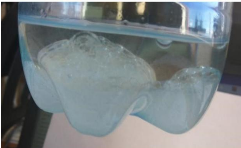
Фото 1. Субстанция, обнаруженная при сливе отстоя

14.08.2018 после выполнения рейса Бодрум (Турция) – Домодедово экипажем самолета А-321 VP-BRS была сделана запись в бортжурнале: «DURING REFUELING L\H WING TANK FUEL QUANTITY TIME TO TIME CHANGE TO AMBER CROSSES» (при заправке левого крыльевого бака, время от времени, показания количества топлива изменялись на оранжевые кресты). По прилету в аэропорт Домодедово, при выполнении очередного технического обслуживания, был осуществлен слив топлива с левого полукрыла, при этом обнаружено большое содержание посторонней мутной желеобразной субстанции (фото 1).