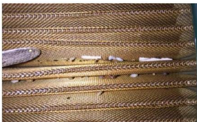
Фото 2. Вид топливного фильтра с примесями

В ходе исследований в НЦ-28 ФГУП ГосНИИ ГА обнаружены нехарактерные химические вещества, часть из которых идентифицирована как полисилоксаны. На фильтрующих поверхностях фильтров обнаружены каучукоподобные соединения полисилоксанов, появившиеся, наиболее вероятно, после полимеризации желеобразной субстанции, произошедшей в условиях работы топливной системы воздушного судна (фото 2 и фото 3).