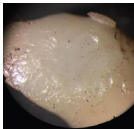
Фото 3. Вид частицы примеси в увеличенном виде

Ранее при проведении исследований в НЦ-28 ФГУП ГосНИИ ГА образцов авиатоплив в ходе расследований авиационных событий и нормальной эксплуатации воздушных судов, примеси такого характера не присутствовали. Попадание в топливную систему воздушного судна подобных посторонних примесей создает